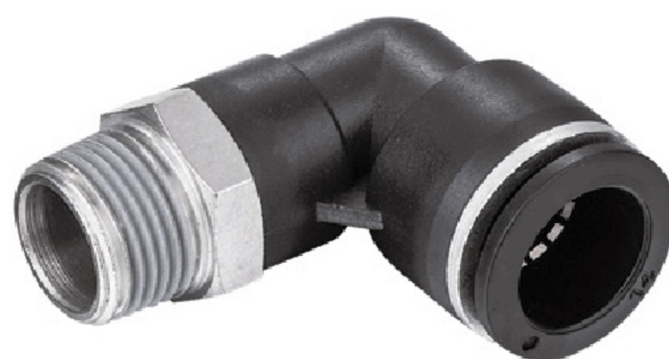
EPL L 型螺紋二通