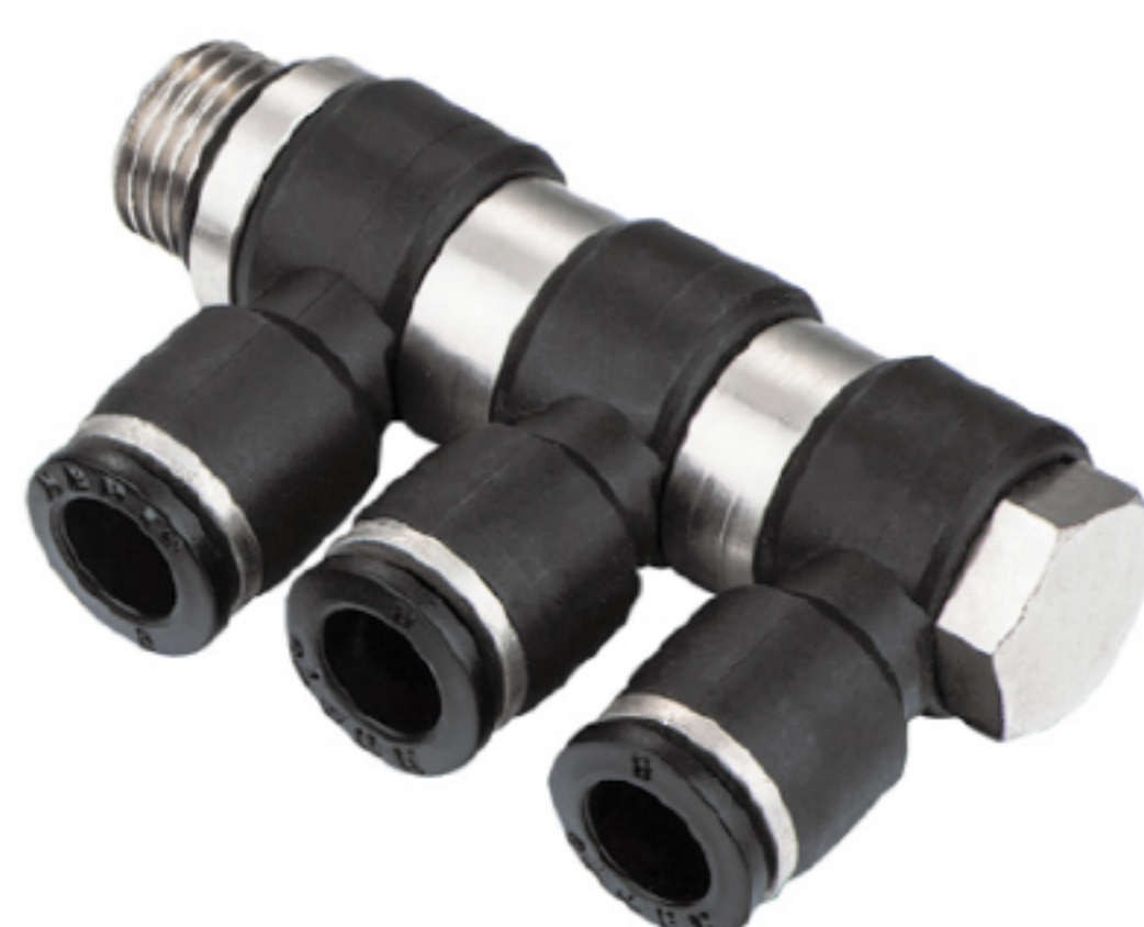
電磁閥 EPHF 串聯接頭