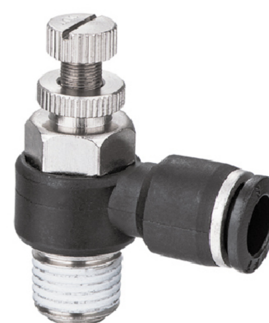
ESL 直接安裝 L 型