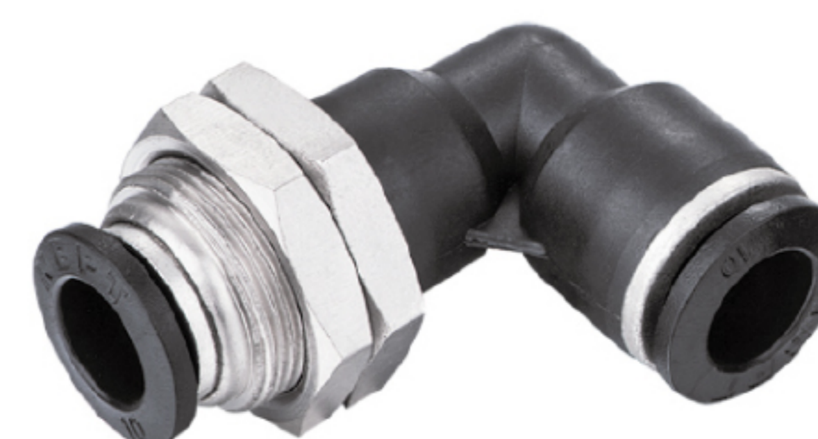
電磁閥 EPML 隔板彎接頭