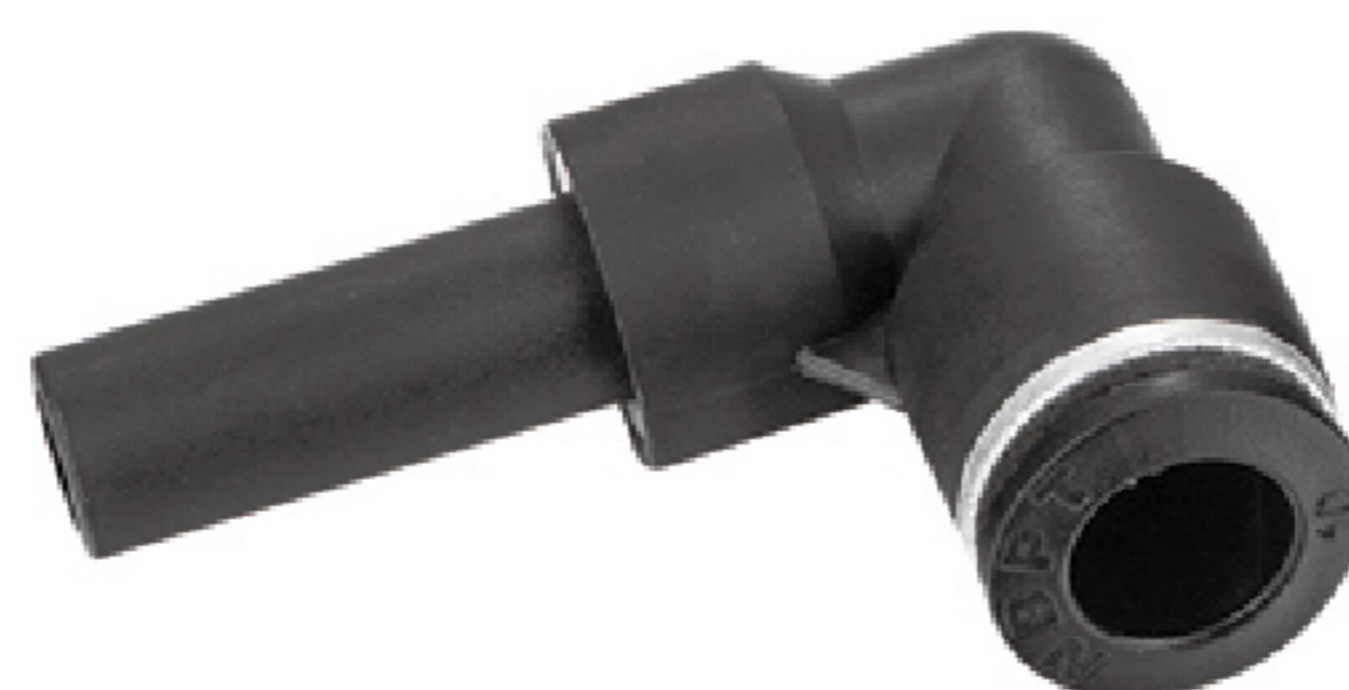
電磁閥 EPLJ L 型插管接頭