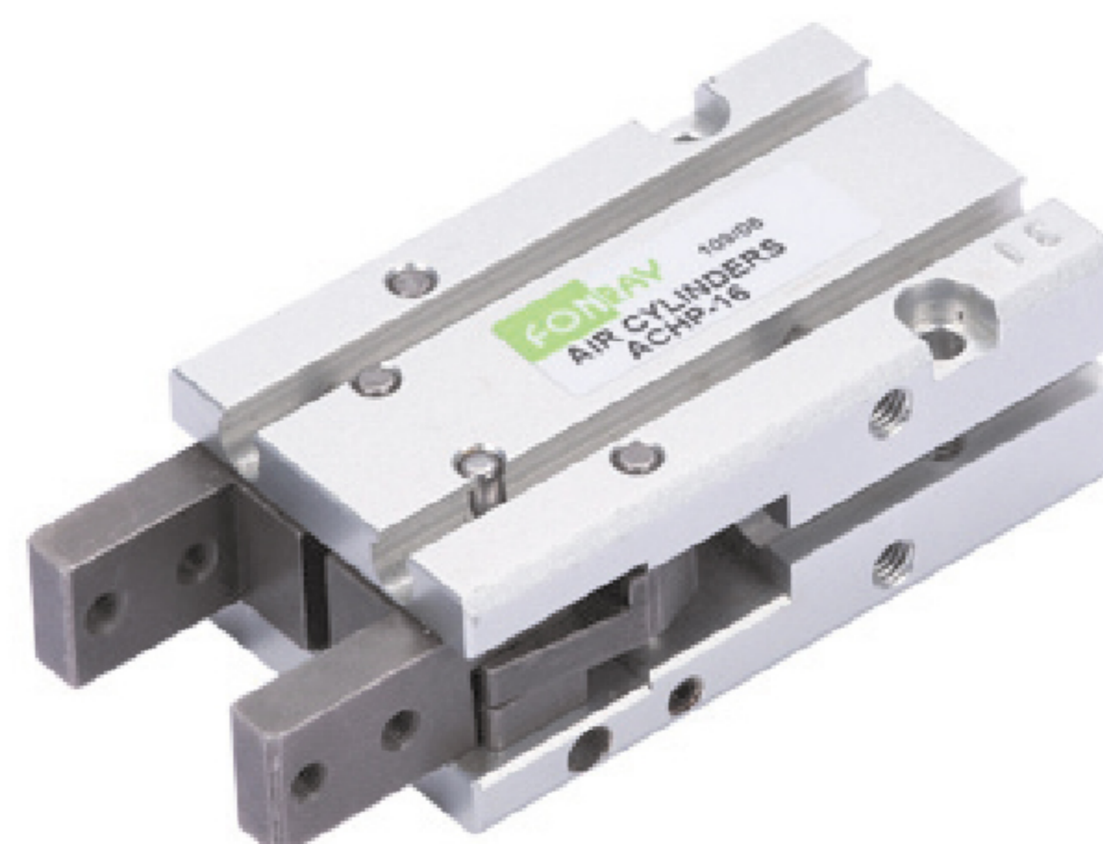
ACHP 型平行夾 Parallel Grippers